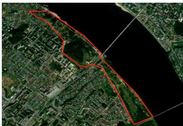
Рис. 3. Спутниковая карта границ парка «Заволжье» в г. Костроме [11]

В настоящее время (2017 г.) часть парка значится как озелененные территории общего пользования и специального назначения [10]. Другую часть планируется застроить гостиничными комплексами, автостоянками и административными зданиями, против чего возражают жители Костромы и общественные организации. Вся эта территория, широкой полосой расположенная вдоль берега реки Волги по факту является озелененной территорией и используется населением в рекреационных целях: для стихийного отдыха, прогулок с детьми, скандинавской ходьбы, рыбалки, для катания на велосипеде, на лыжах, на снегоходах. Общественность выступила с предложением сохранить данную территорию для создания ландшафтного парка (рис. 3).