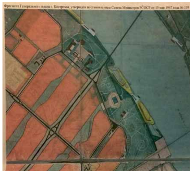
Рис. 2. Территория, которая отводилась для создания Центрального парка на правом берегу р. Волги, согласно генеральному плану г. Костромы 1967 г. [6] Fig. 2. The territory that was allocated for the creation of Central Park on the right bank of the river. Volga, according to the general plan of Kostroma in 1967 [6]