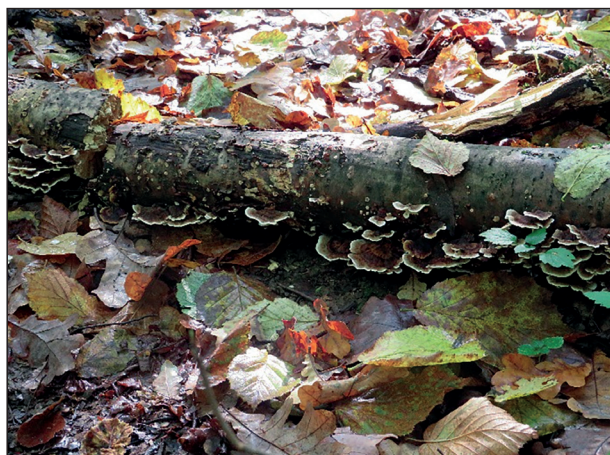
Trametes versicolor (L.Fr.) Pilat. Кориол разноцветный