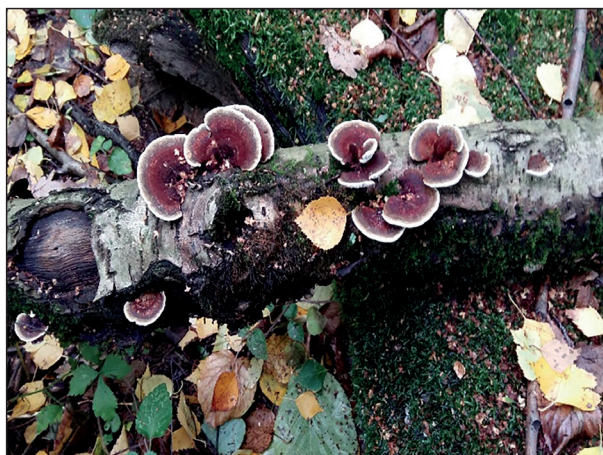
Lenzites betulinus (L.) Fr. Ленцитес березовый