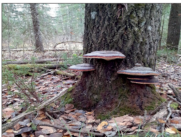
Ganoderma applanatum (Pers.) Pat. Плоский трутовик