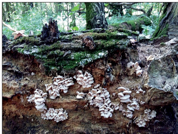
Pleurotes ostreatus (Fr.) Kumm Вешенка устричная