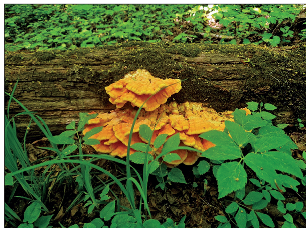
Laetiporus sulphureus (Bull.) Murril Серно-желтый трутовик