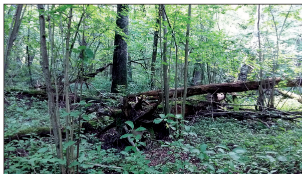
Рис. 2. Фрагмент лесного насаждения на территории ГБС Fig. 2. Fragment of a forest plantation in the GBS territory

создают биогеоценозы с умеренно обедненной структурой. Причем в буферной зоне Заповедной дубравы можно наблюдать более ровную и благополучную картину. Внутри же заповедного ядра явно выделяется центральная зона с наиболее сохранившейся структурой (ППЗ и ПП4), а краевые участки — качественно ниже (см. табл. 2). Интересно, что в данном случае на значения ИСР влияют не формирование тропиной сети и не трансформация травяно-кустарничкового яруса (его олуговение и рудерализация), характерные для городских и пригородных лесопарков. Так, сильно выраженной тропиной сети с минерализованными участками почвы нет, хотя не являются редкостью следы пребывания «стихийных рекреантов», приуроченные главным образом к скоплениям валежа, в том числе и в заповедной зоне. В травяно-кустарничковом ярусе преобладают виды лесных эколого-ценотических групп (табл. 3). Доминируют зеленчук желтый ( Galeobdolon luteum ), сныть обыкновенная ( Aegopodium podagraria ), осока волосистая ( Carex pilosa ), копытень европейский ( Asarum europaeum ), пролесник многолетний ( Mercurialis perennis ). Сорные виды практически отсутствуют, а из заносных — повсеместно, но со сравнительно небольшим обилием, отмечена недотрога мелкоцветковая ( Impatiens parviflora ). И в буферной зоне, и в заповедном ядре хорошо развит подлесочный ярус из лесных видов: рябины обыкновенной ( Sorbus aucuparia ), черемухи обыкновенной ( Prunus padus ), бересклета бородавчатого ( Euonymus verrucosus ), жимолости обыкновенной