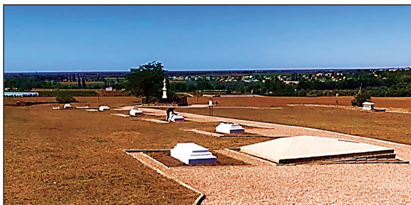
Рис. 6. Общий вид территории Военно-исторического мемориала «Поле Альминского сражения» с мемориальными объектами офицерам и солдатам