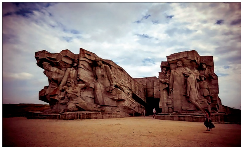
Рис. 2. Мемориальный комплекс — музей истории обороны «Аджимушкайские каменоломни». Скульптурная группа «Стена героев» у входа