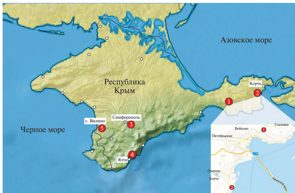
Рис. 1. Мемориальные комплексы Республики Крым: 1 — Мемориальный комплекс — музей истории обороны «Аджимушкайские каменоломни»; 2 — Мемориальный комплекс «Героям Эльтигенского десанта»; 3 — Военно-историческое кладбище участников Крымской войны 1853–1856 годов и могила генерал-лейтенанта А.К. Абрамова, командира 13-й пехотной дивизии; 4 — Мемориальный комплекс в честь героев Гражданской и Великой Отечественной войн; 5 — Мемориальный комплекс «Поле Альминского сражения»