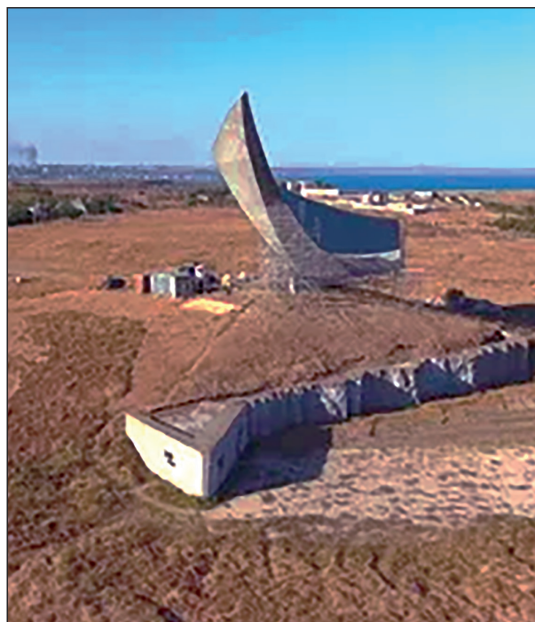
Рис. 3. Общий вид мемориального комплекса «Героям Эльтигенского десанта» (ссылка на сайт: https://yandex.ru/images/searchhp=2&source=serp&text=Героям+Эльтигенского+десанта )

Музейная и административная функциональные зоны на объекте не представлены.