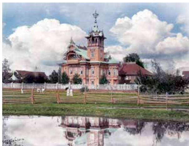
Рис. 1. Вид на усадьбу и терем в деревне Асташово в начале XX в. (1908 г.)

Основой его объемного построения является прямоугольный сруб, вытянутый по оси восток —