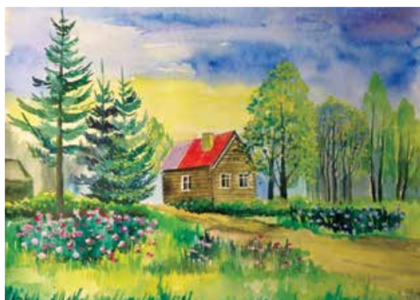
Fig. 5. Formula of a glade in the former village of Astashovo (option 1)