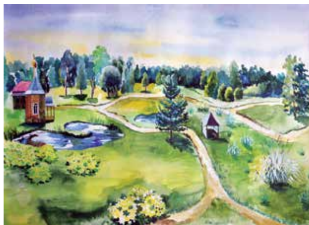
Рис. 5. Композиционное решение для поляны в бывшей деревне Асташово (вариант 1)

Второй вариант композиционного решения основан на другой идее, характерной для усадеб: «Каждый старинный парк, несмотря на свою типичность, имеет какую-то характерную, только ему присущую отличительную черту. И эта особенность в усадьбе Ершово, спрятавшейся вдали от Москвы-реки, незабудки. Здесь такое количество этих цветов, что луга и куртины парка вокруг дома кажутся покрытыми сплошным голубым ковром» [20]. На наш взгляд, данный старинный прием уместен и для поляны бывшей деревни Асташово (рис. 6).